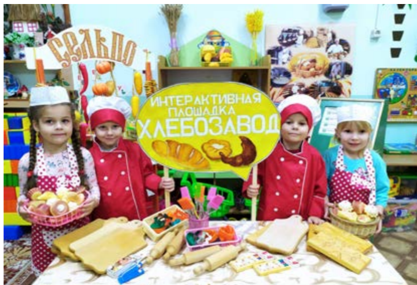
Рисунок 4. Интерактивная площадка «Хлебозавод», МБДОУ МО г. Краснодар «Детский сад № 85», 2023 г.