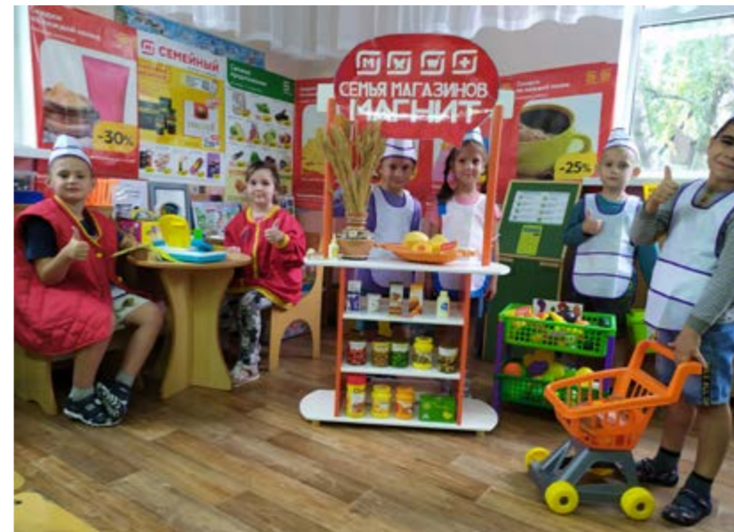
Рисунок 2. Интерактивная площадка «Супермаркет «Магнит», МБДОУ МО г. Краснодар «Детский сад № 85», 2023 г.

Поэтому для дошкольника финансовая грамотность – это формирование нравственных основ финансовой культуры и развитие нестандартного мышления в области финансов, включая творчество и воображение [4, с. 12].