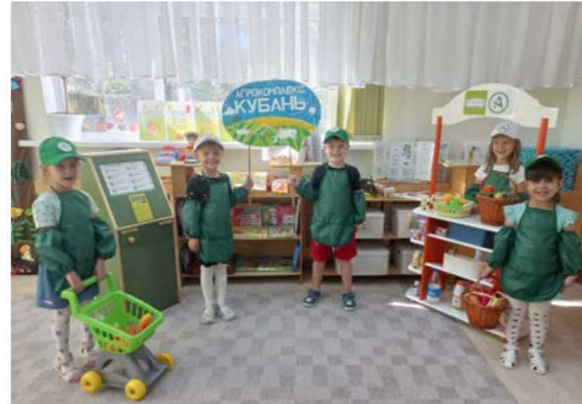
Рисунок 1. Интерактивная площадка «Агрокомплекс «Кубань», МБДОУ МО г. Краснодар «Детский сад № 85», 2023 г.

Одной из важных составляющих общей и экономической культуры человека является финансовая грамотность. Приобщение дошкольника к финансовой грамотности не означает ознакомление его со специфическими понятиями и работой финансовых институтов, а приближает воспитанника к реальной жизни, пробуждает экономическое мышление, позволяет приобрести качества, присущие настоящей личности через игровые формы и методы.