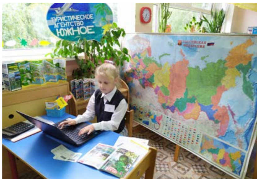
Рисунок 3. Интерактивная площадка «Турагентство «Южное», МБДОУ МО г. Краснодар «Детский сад № 85», 2023 г.

На примере ярких, впечатляющих примеров взрослых, особенно родителей и членов семьи, мы воспитываем в детях бережное отношение к личной и общественной собственности, семейным материальным ресурсам, коллективизм, побуждение к взаимопомощи и поддержке, желание делиться и отдавать, помогать ближнему [5]. На примере людей-тружеников в различных сферах